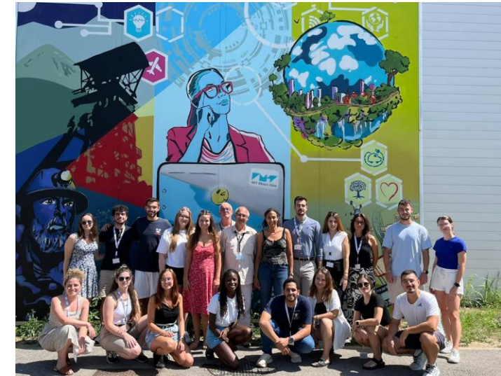
EULiST 2 nd BIP στο IMT “Student Engagement” 18 – 24 /8/2024