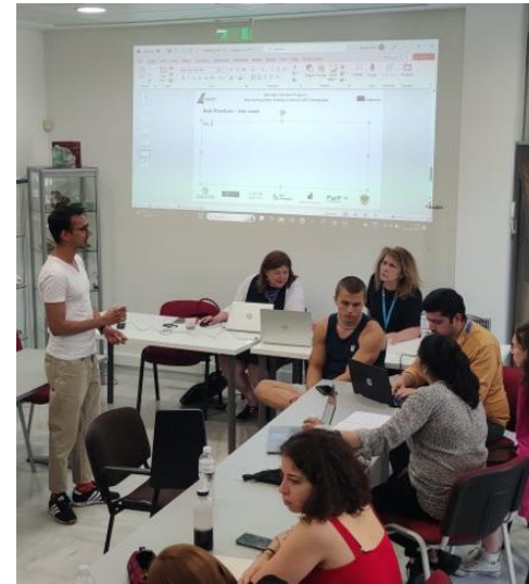
EULiST 1 st BIP στο ΕΜΠ “Monitoring clean energy in the EULiST campuses” 31/5 - 13/10/2023