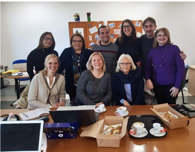
Student and Staff Opportunities

EULIST URJC Διαδικτυακό Course «Communication and Dissemination for European Projects», 18-21/11/2024